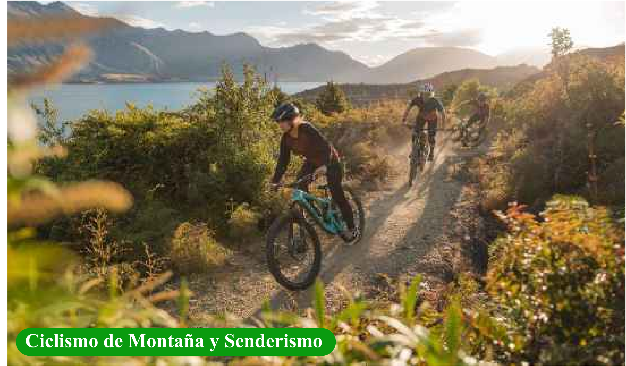
Ciclismo de Montaña y Senderismo