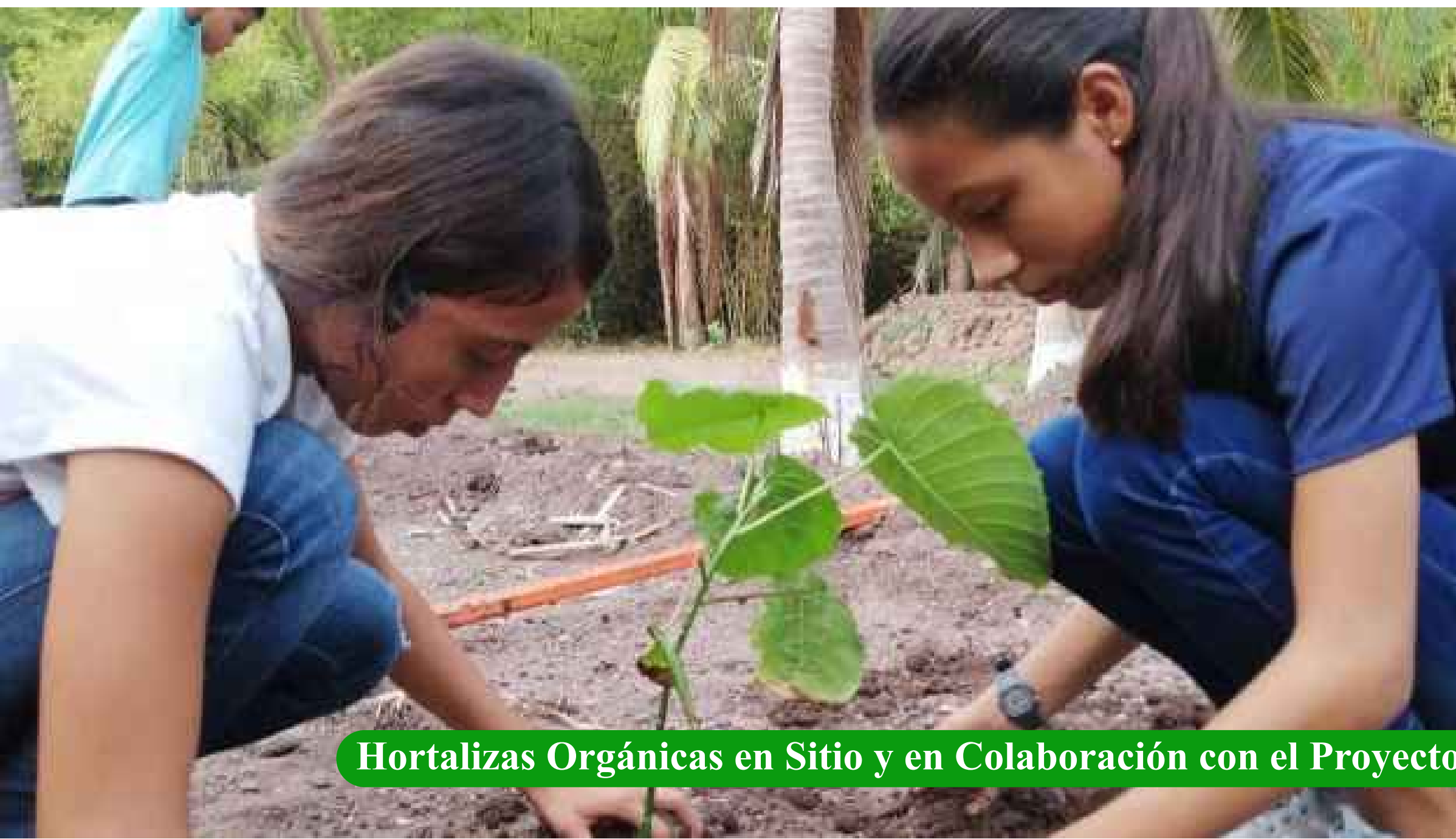
Hortalizas Orgánicas en Sitio y en Colaboración con el Proyecto del Huerto Escolar de la Escuela Primaria de Arroyo Seco