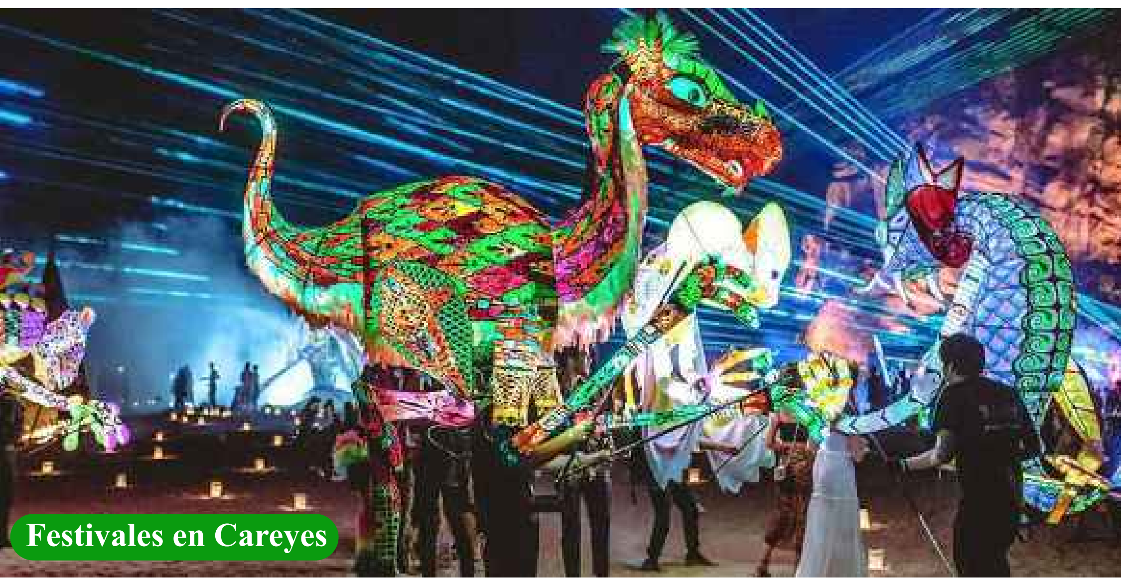
Festivales en Careyes