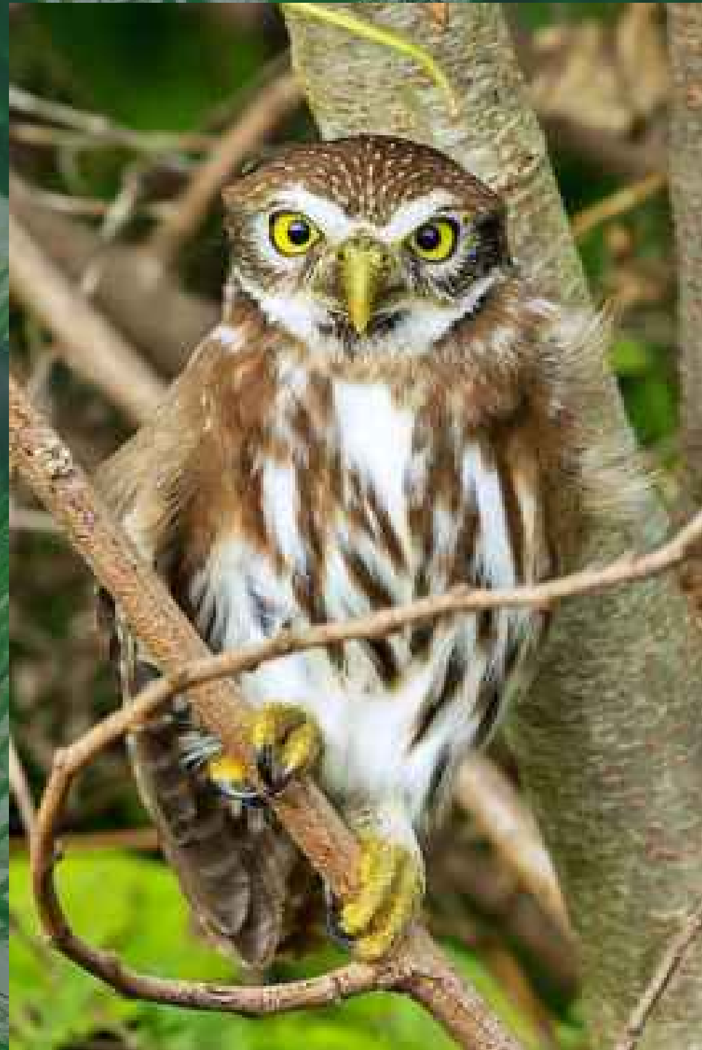
Búho Pigmeo Ferruginoso