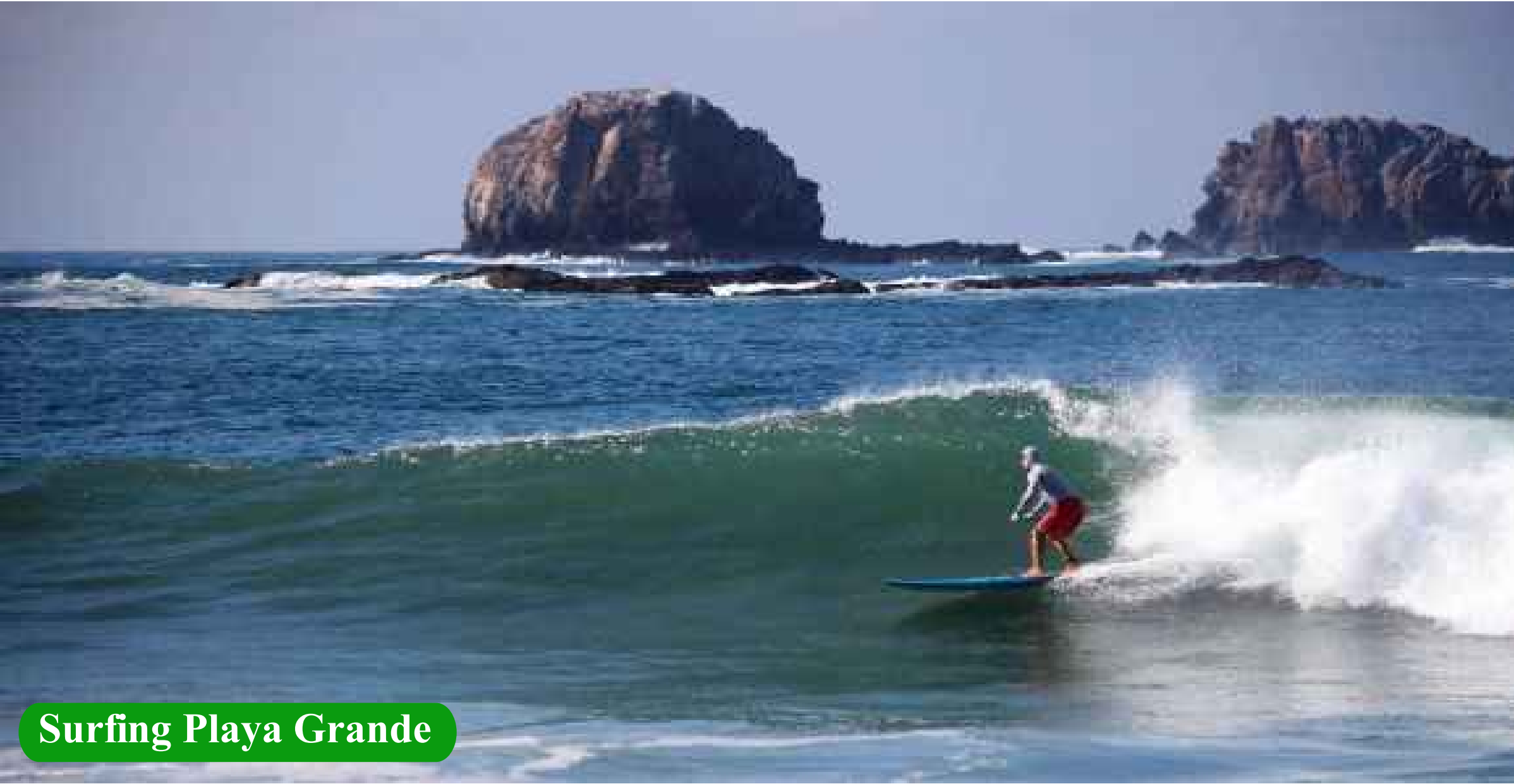
Surfing Playa Grande