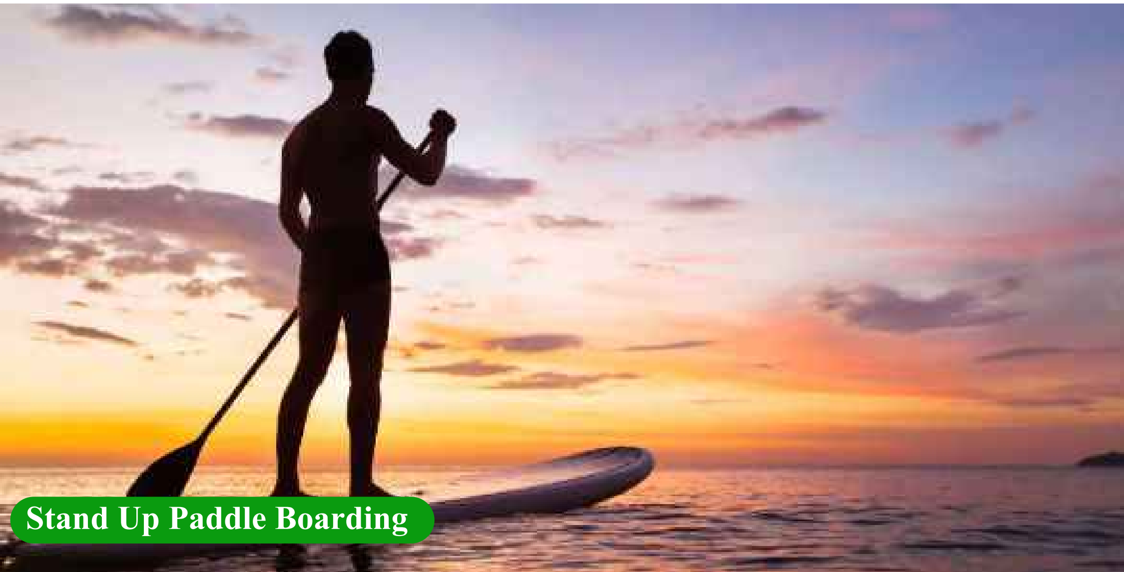
Stand Up Paddle Boarding